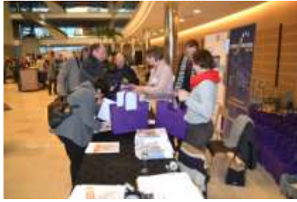
En fin de journée : la distribution des kits d'expériences