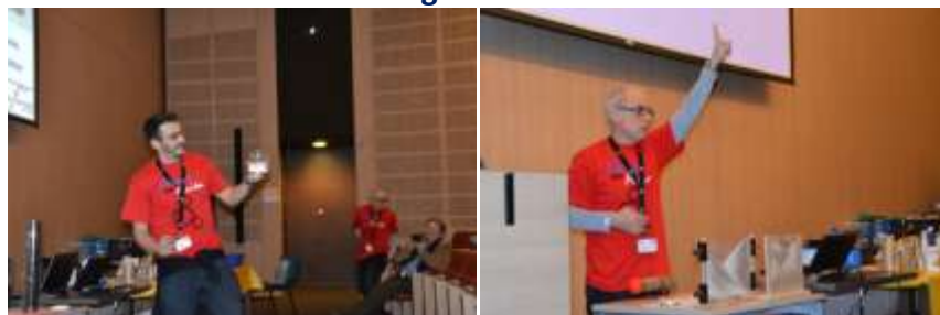
La délégation espagnole