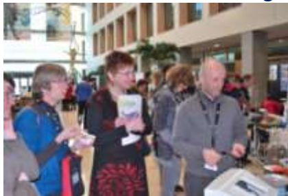
la délégation espagnole