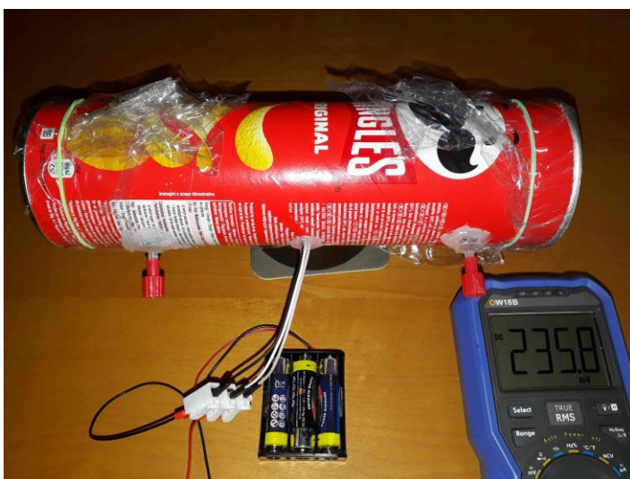
Fig. 1a: Boîte à pringel pré-chargée avec tubulure et capteur. La tubulure est une seringue utilisée dans le domaine médical.

Les deux extrémités sont fermées avec du film transparent ménager :